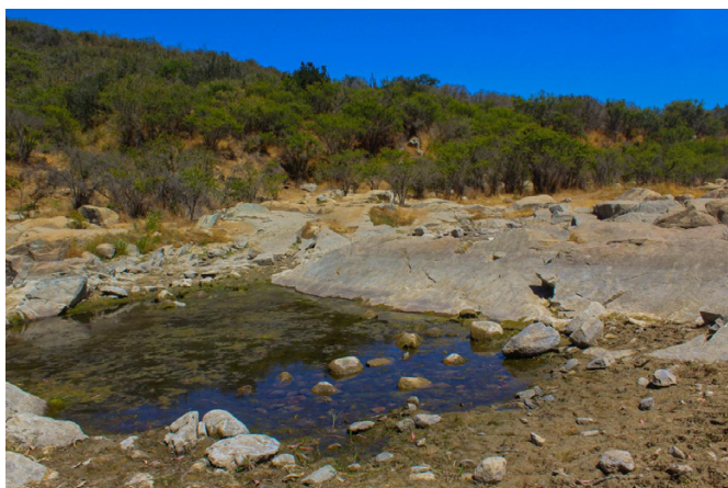
Figura 1: Vista general de la poza ubicada en el Parque Natural Cerro Los Pinos, Quilpué.

En este contexto, nuestras observaciones se realizaron en una de las pozas del Parque Natural Cerro Los Pinos (-33.080035°, -71.428497°) situada en un tramo del estero Marga-Marga, reconocido en la actualidad como estero Margarita, que perdura un largo plazo durante el verano y depende de la cantidad de lluvia caída durante el año (Fig. 1). La poza se encuentra compuesta por un afloramiento rocoso y entre su vegetación inmediata se encuentran especies