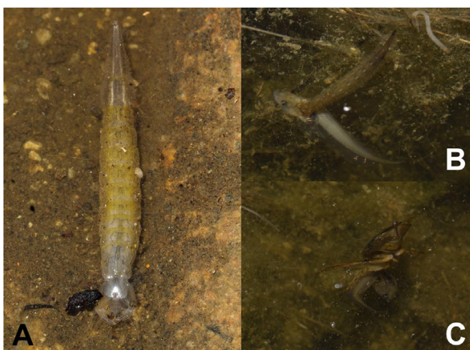
Figura 3: A) larva de Megadytes australis , B) depredación de Xenopus laevis por larva de Megadytes australis y C) depredación de Xenopus laevis por Belostoma elegans .

Si bien, dos de estos registros no están exentos de intervención humana, los Dytiscidae son reconocidos como depredadores de huevos y larvas de anfibios (Wells 2007), con casos registrados de Megadytes depredando sobre adultos (Zina et al. 2012, Oliveira et al. 2013). Por su parte, los Belostomatidae son reconocidos como depredadores de adultos y larvas de anfibios, a los cuales cazan esperando entre la vegetación o en el barro del fondo, hasta que la presa se encuentre al alcance de su primer par de patas raptoras, existiendo variados casos registrados para el género Belostoma (Wells 2007, Aristizábal-García 2017, Segura y Faúndez 2020). Consideramos que estos casos de depredación son aparentemente comunes, especialmente en pozas semipermanentes, donde a medida que la poza se va secando, aumenta la probabilidad de interacción entre las especies.