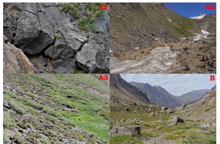
Figura 3: Fotografías de los distintos tipos de hábitat en el área de estudio.

Un total de 121 individuos fueron observados, que puede considerarse como un mínimo de abundancia para esta zona, siendo una de las más altas reportadas para el género en Chile. Por ejemplo, Araya (2007) en El Enladrillado (localidad tipo de P. maulense ), Reserva Nacional Altos de Lircay, Región del Maule, recolectó 37 individuos (12 machos, 20 hembras y 5 juveniles) durante cuatro visitas en época estival. Esta población dentro del área protegida se ha mantenido en buen estado de conservación y estable a lo largo de los años (Espejo 2016). Alzamora et al. (2010) reportaron 37 individuos (entre machos, hembras y juveniles), juntos bajo una misma roca y soportando bajas temperaturas en el sector de Laguna