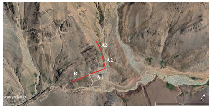
Figura 2: Área de estudio y líneas de transecto (zonas o sectores).

estos se encontraban termoregulando o asomándose desde sus refugios. Los resultados del muestreo se muestran en la Tabla 1.