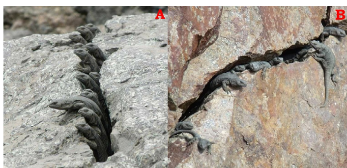
Figura 4: Grupos de hembras de Phymaturus maulense . A) Zona del actual estudio, B) Zona al otro lado del río Las Damas.