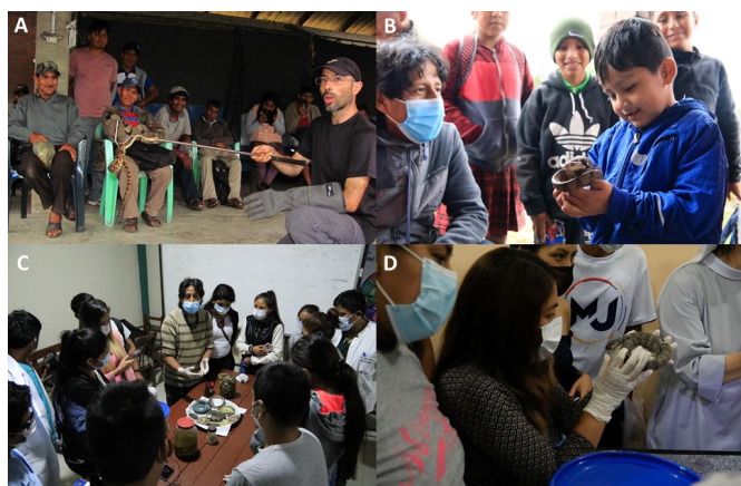
Figura 4: Actividades realizadas dentro del programa educativo de Proyecto Pucarara en el Chapare, Amazonía Boliviana: (a, b) Talleres de educación ambiental, educación en prevención y primeros auxilios en comunidades, (c, d) Talleres de capacitación a personal médico en epidemiología y diagnóstico del ofidismo.