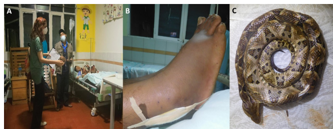
Figura 2: Muestreo de mordeduras de serpiente en el Hospital Central Ivirgarzama, Bolivia: (a) Entrevista a paciente, (b) Accidente ofídico por laripanoqa ( Bothrops sanctaerucis ) y (c) Especimen de laripanoqa ( B. sanctaerucis ) llevado al hospital por un(a) paciente.

Dicha información ha sido recopilada mediante un estudio prospectivo de un año (diciembre 2019-noviembre 2020) en el Hospital Central Ivirgarzama (HCI) (Departamento de Cochabamba). El HCI es un hospital rural que da cobertura a alrededor de 150.000 habitantes y atiende a más de 20.000 pacientes por año (Mamani et al. 2013). El estudio se realizó a través de entrevistas a pacientes, revisión de historias clínicas y colecta de especímenes de serpientes muertas cuando fue posible (Fig. 2). Luego de analizar 152 casos, nuestros resultados preliminares muestran que la mayoría de las mordeduras se producen en zonas de cultivo durante actividades agrícolas o en caminos y en los alrededores de casas de campo, coincidiendo con labores domésticas. Los accidentes ofídicos ocurren durante todo el año, pero especialmente en los meses más cálidos y lluviosos (noviembre-marzo). Las personas adultas laboralmente activas son más afectadas y numerosas especies de serpientes están involucradas en estos casos, destacando de forma notoria las víboras laripanoqa ( Bothrops sanctaerucis Hoge 1966) y lora ( B. bilineatus Wied-Neuwied 1821), la culebra yaku katari ( Helicops angulatus Linnaeus 1758) y la boa Corallus hortulana Linnaeus 1758 (Tabla 1).