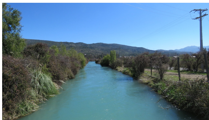
Figura 3: Foto ambiente del canal de distribución de agua para la central hidroeléctrica Coya (canal Chacayes), cuenca del Alto Cachapoal, Región de O'Higgins.

Los antecedentes disponibles hasta el momento indican que esta especie podría sobrevivir en las condiciones de temperatura registradas en el área de estudio (Tabla 2; Bartheld et al. 2017; Vidal et al. 2017) y que es capaz de habitar ambientes de origen antrópico como canales de regadío y lagunas artificiales (Lobos et al. 2013a; Rabanal y Nuñez 2009; Rottmann 2012). No obstante, aún no hemos observado estadios larvales, por lo que es necesario continuar con los monitoreos en la temporada reproductiva para confirmar si las características de los hábitats de esta zona cumplen con los requerimientos de esta especie.