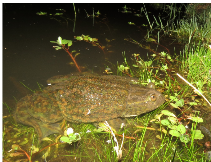
Figura 2: Ejemplar hembra adulta de rana chilena ( Calyptocephalella gayi ) en laguna Los patos (sitio 5), sector Chacayes, cuenca del Alto Cachapoal, Región de O'Higgins.

laguna Los Patos (Figs. 1 y 2; Tabla 1) ubicado a 1.286 m. También detectamos la presencia de individuos en un canal de la central hidroeléctrica Pacific Hydro que se remonta al año 1911. Se caracteriza por poseer algunos tramos abovedados pero mayormente por poseer sustrato natural, aguas lóaticas y pequeños remansos de aguas lénticas (Fig. 3; Tabla 1). Este reporte se basa en registros fotográficos. No hay recolección de voucher debido al estado de conservación de la especie y a sus características morfológicas que la distinguen fácilmente del resto de las especies presentes en el ensamble.