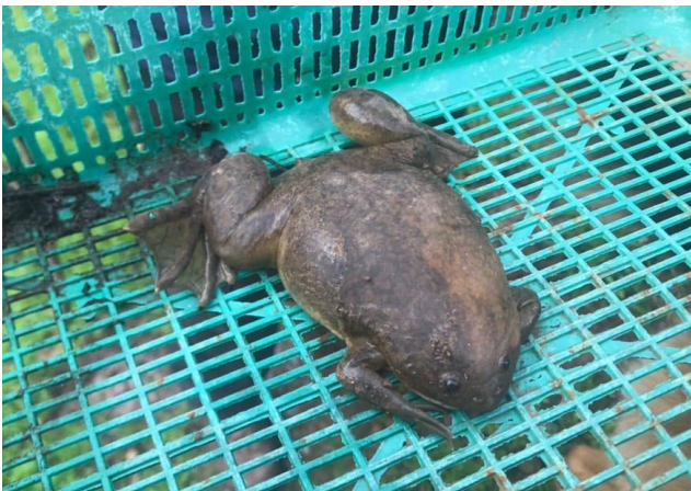
Figura 1: Ejemplar adulto de Xenopus laevis en Hualañé (MNHN 5838).

El día 19 de julio de 2020, fue encontrado un individuo adulto de la rana africana Xenopus laevis (Daudin 1802) en la ciudad de Hualañé, Región del Maule (34° 58' S, 71° 47' O). El ejemplar se observó al lado de una calle pavimentada, bajo unos escombros de construcción y cercano a un curso de agua de baja profundidad. El área presenta una vegetación dominada por un matorral de espino ( Acacia caven ) y un parche de vegetación exótica ( Eucalyptus globulus ). El individuo fue fotografiado y posteriormente identificado por el tamaño y la presencia de grandes garras en sus patas (Fig. 1). La fotografía fue depositada en la colección del Museo Nacional de Historia Natural de Chile (MNHN). Dado el tamaño, aspecto y patrón es importante presentar este registro, ya que se suma a los encontrados en la zona como uno de los registros más al sur con la presencia de esta especie (Mora et al. 2019), así como también uno de los más cercanos a centros urbanos en este límite de distribución (Fig. 2).