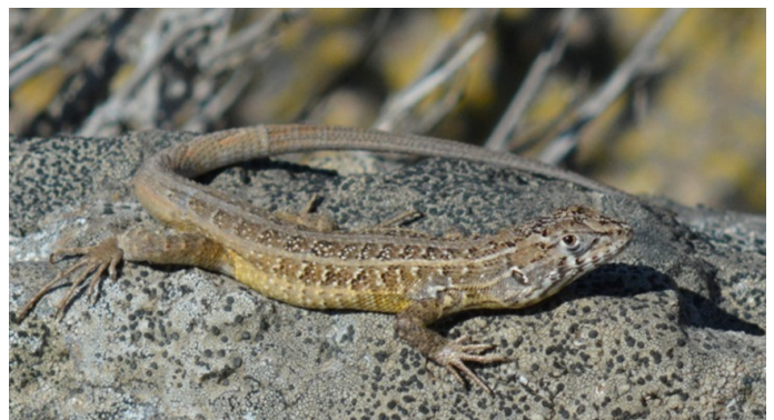
Figura 1. Macho de Liolaemus pseudolemniscatus Lamborot y Ortiz 1990 observado en la localidad de El Panul, Región de Coquimbo, Chile.

En este trabajo entregamos un nuevo registro que amplía su distribución latitudinal en Chile.